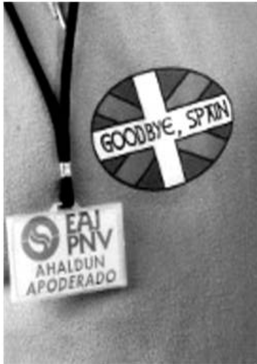
Pegatina en el pecho de un apoderado del PNV en el Alderdi Eguna